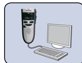
Audio USB per dettatura al PC