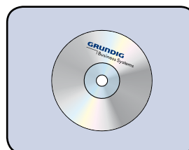
Incl. Software DigtaSoft